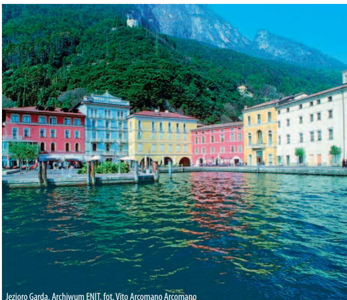
Jezioro Garda