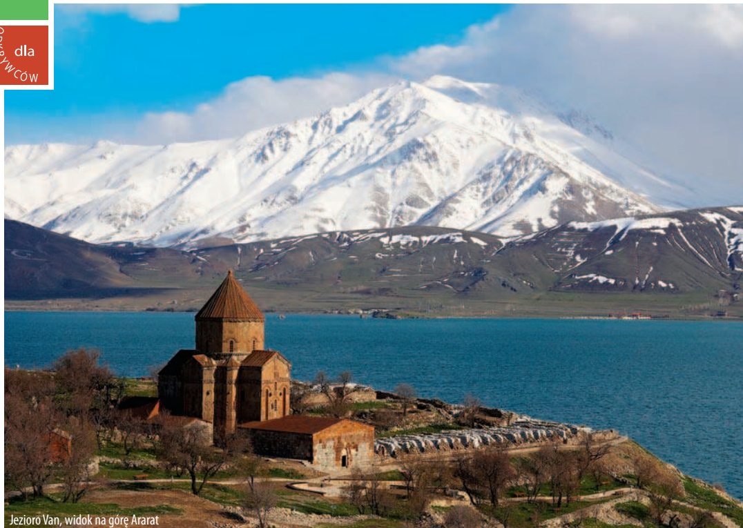
Jezioro Van, widok na górę Ararat