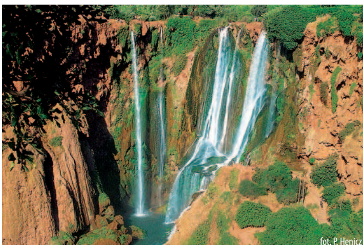
fol. P. Henicz